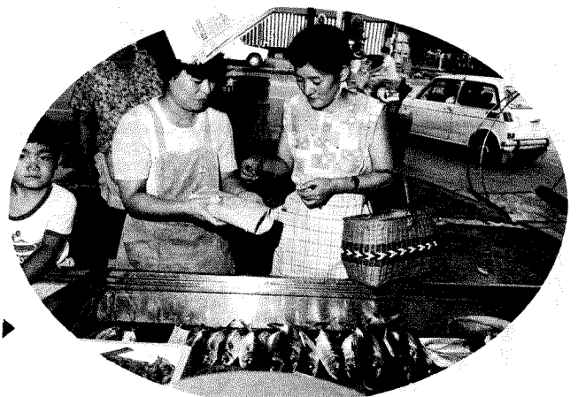
安全な魚を食卓へ▶