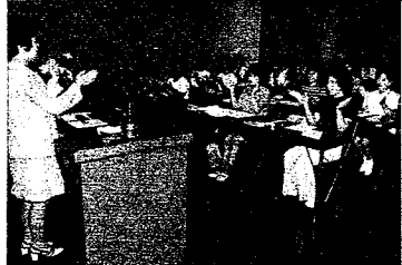
幼児教育の中堅指導者養成をめざして開かれた保母大学講座

八月一日から十日間、和歌山市の社会福祉センターで初の保母大学講座が開かれました。 県下各地の保育所から五十人の保母さんが参加し、保育に関する理論や実技の講座、施設の見学、座談会など充実した宿泊研修を受けました。