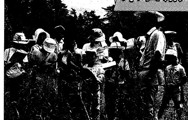
郷土の美しい自然を守ろう——8月に和歌山市加太国民休暇村で開かれた自然スクール