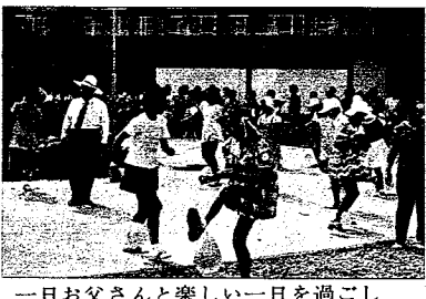
一日お父さんと楽しい一日を過ごしました。

西牟婁郡上富田町にある南紀療育園にプール完成し、去る八月四日にプール開きが行なわれ、水深の浅い遊泳場と普通