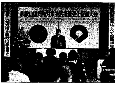
東京大会に250人が参加

来年度の昭和四十八年度は、十カ年の時限立法である「同和对策事業特別措置法」が施行されてから五年目、また「同和对策長期計画」の前期五カ年が終わる年にもなります。