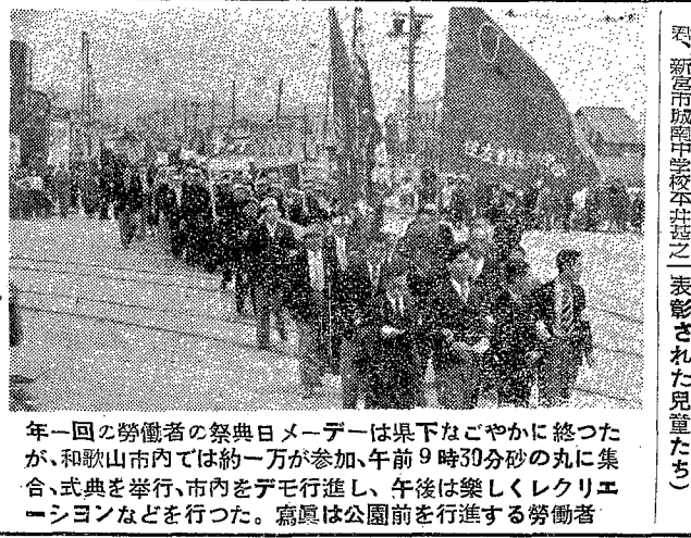
年一回の労働者の祭典日メーデーは県下なごやかに終わった。和歌山市内では約一万が参加、午前9時30分頃の丸に集合、式典を挙行、市内をデモ行進し、午後は楽しくレクリエーションなどを行った。写真は公園前を行進する労働者

県では子供の日の五月五日に、優良赤ちゃんを表彰した。優良赤ちゃんとは、五月五日に生まれた赤ちゃんを指す。表彰された児童は、県内各地から選ばれた。