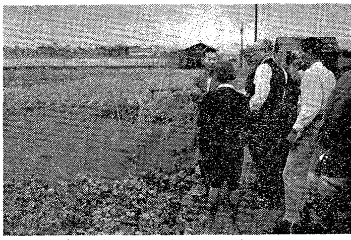
海南市附近の耕地冠水状況を観る小野知事