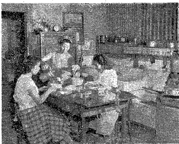
この写真は、戦時中の家族の生活の様子を示している。戦時中は、物資が乏しく、生活は非常に厳しかった。しかし、家族の絆を大切にしながら、生活を送っていた。この写真は、戦時中の家族の生活の様子を示している。

くすりを正しく使うためには、正しい知識を身につけることが大切である。正しい知識を身につけるためには、医師や薬剤師の指導を受けることが大切である。また、くすりの正しい保管方法や、飲み忘れの対処法についても、医師や薬剤師の指導を受けることが大切である。