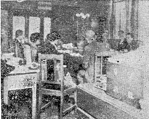
十一月三日の第二回「文化の日」座談會の寫眞

十一月三日の第二回「文化の日」を迎え、本紙では別掲名士の方々を招いて「文化について語る」座談会を開催し、縣民の文化に對する關心を深め、文化日本再建の一助に資することにした(寫眞は會場)