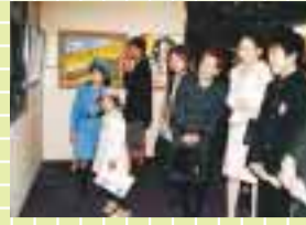
米国フロリダ州ファーストレディプロジェクト交流絵画展(和歌山市)